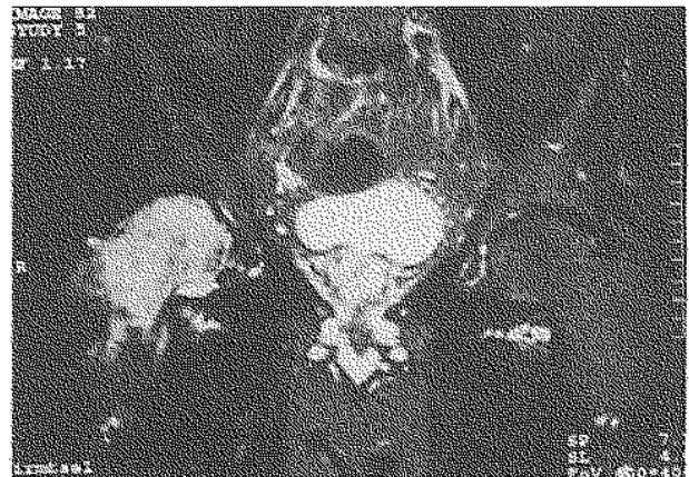
Fig. 2b. — IRM, Séquence pondérée en T2. Coupe coronale qui montre un hypersignal de la médullaire de la tête et du col fémoral.