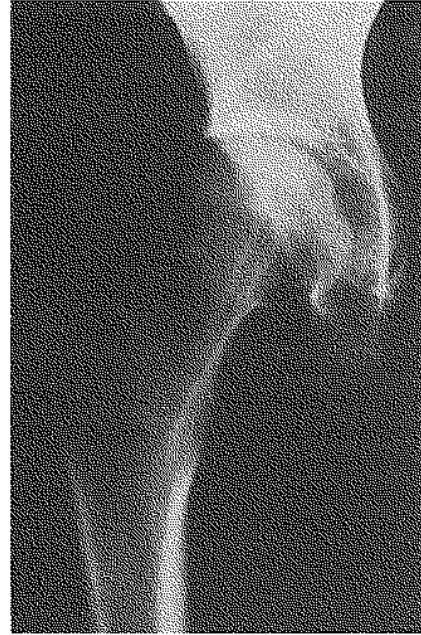
Fig. 1b. — Deux mois après, on peut observer une meilleure délimitation du contour de la tête fémorale et l'augmentation de la densité osseuse.