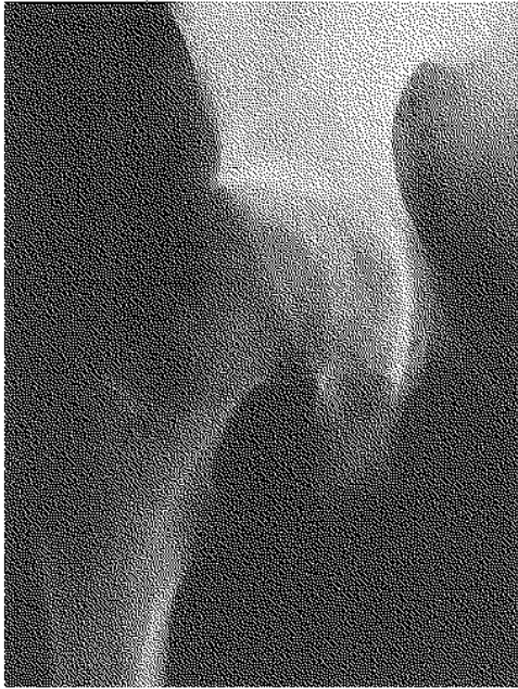
Fig. 1a. — Cliché de bassin de face qui montre une perte de relief osseux de la tête fémorale, avec absence de la bande dense sous-chondrale et diminution de la densité osseuse.